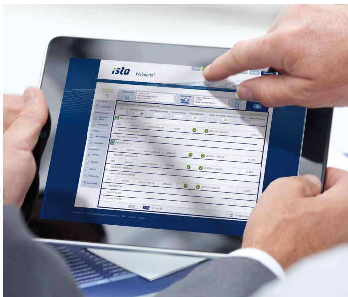
Im ista Webportal haben Sie den Gerätestatus immer im Blick.

Ab sofort bieten wir bei ista neben der Servicevariante Classic auch die komfortable Funk-Fernprüfung an. Die Aktivierung der Schnittstelle zur Funk-Fernprüfung ist auch noch zu einem späteren Zeitpunkt möglich.