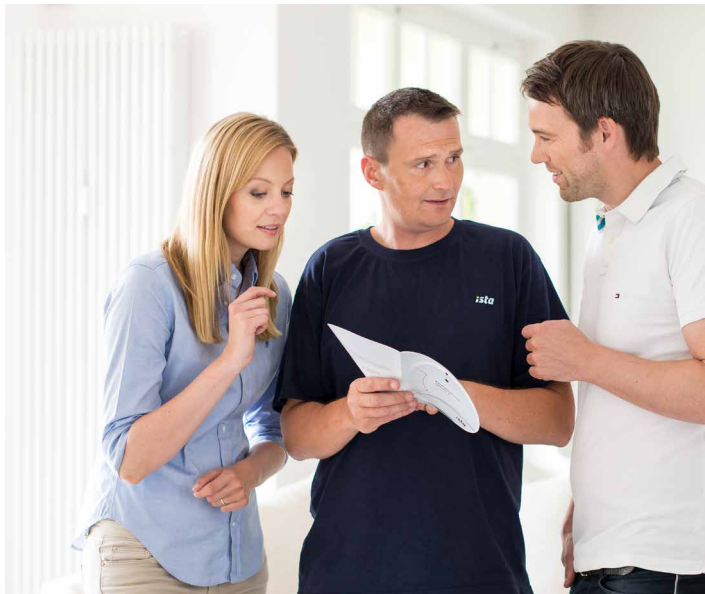
Nach der Montage übergibt die Fachkraft die Informationsbroschüre an die Mieter.

Von der Terminvereinbarung mit Ihren Mietern bis zur normgerechten Installation: Wir erledigen alle im Zusammenhang mit der Montage anfallenden Aufgaben. Sie müssen sich um nichts kümmern.