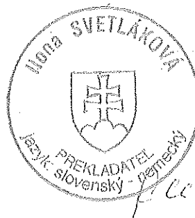
Ilona Svetláková súdna prekladateľka