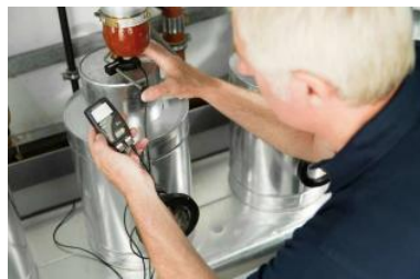
Un operario revisa la instalación de la calefacción central de un edificio. ista

Una directiva europea obliga a instalar desde el próximo 1 de enero sistemas de medición individual de consumo en las viviendas que disponen de calefacción central con la finalidad de repartir costes. A estas alturas del año, sin embargo, el Gobierno en funciones aún no ha adaptado la normativa española a la europea, lo que deja a más de 100.000 familias gallegas en la incertidumbre sobre si deben instalar estos medidores o no. El Ejecutivo no tiene previsto aprobar la normativa sobre la materia mientras esté en funciones y eso deja poco margen a las comunidades de vecinos. El nuevo Gobierno estará conformado como pronto en julio y las actuaciones necesarias para adaptar las viviendas deberían realizarse cuando la calefacción está parada, en verano