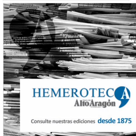
IMÁGENES DEL DÍA