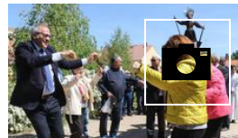
📷 Valladolid festeja a San Isidro