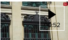
📺 Descubre la calle capítulo 118