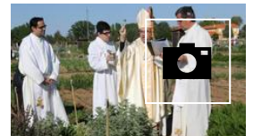
📷 Celebración de San Isidro Labrador y vendición de los huertos en Inea