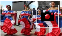
📷 Danzas Interculturales en la plaza mayor de Valladolid