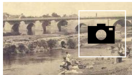
📷 El Puente Mayor de Valladolid a través de los años