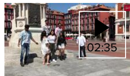
📺 Bollywood llega a Valladolid