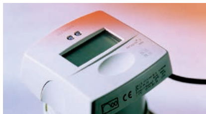
sensonic® II – Energimätare