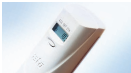
doprimo® radio – Värmefördelningsmätare