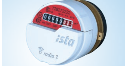
istameter® m – Vattenmätare med radiomodul