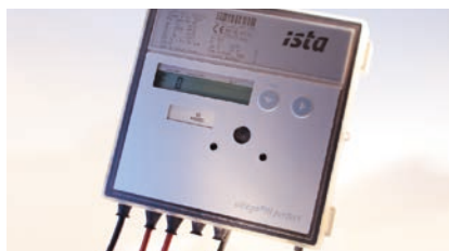
ultegeo® perfect/eco – Värmeenergimätare