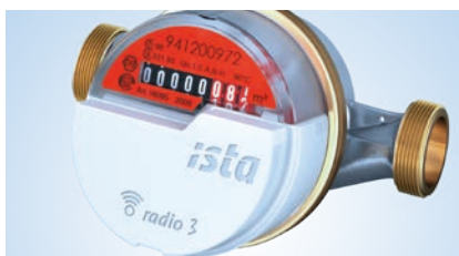
domaqua® m – Vattenmätare med radiomodul