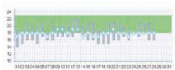
Gennemsnits temperaturmåling for alle målerne i lejemålet i en måned.

T-Loggeren er særlig velegnet til at supplere en varmeenergimåler, så du opnår samme overblik, som hvis du brugte varmfordelingsmålere på radiatorerne.